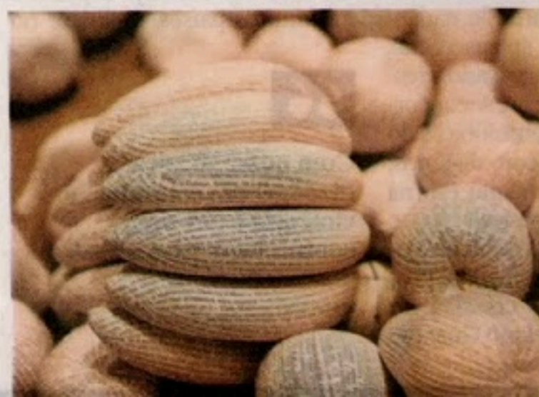
Expurgo. Na instalação do indiano Martand Khosla, frutas representam os favelados