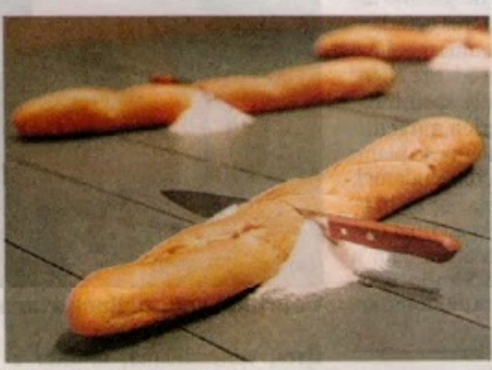
Exílio. Gosto amargo de ser estorvo sugerido por Estrangeiro instalação do romeno Cantor