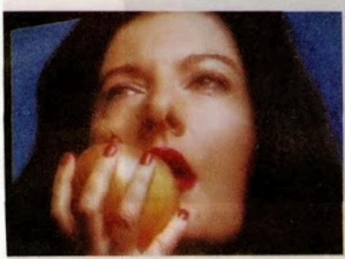
Dor. Marina Abramovic come uma cebola crua e reclama da sua vida em vídeo feito em 1995