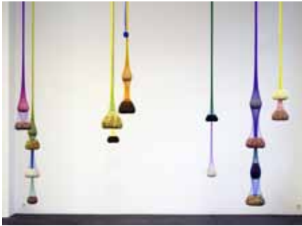
Variation on Color Seed Space Time Love, 2009 filets en plastique, haricots

Né en 1964, à Rio de Janeiro, où il vit et travaille.