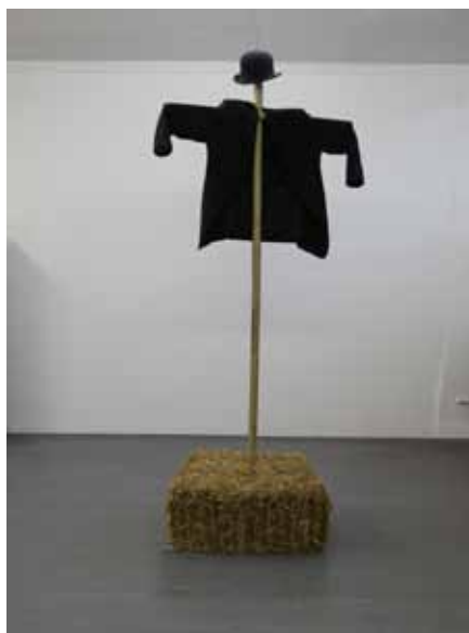
Spauracchio, 2012 bois, étoffe, paille

Né à Sondrio (Italie) en 1958. Vit et travaille à Genève.