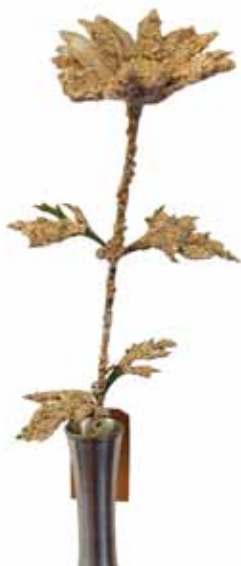
Fleur Bluemay-Ode, 1969 fleur en plastique recouverte de céréales 50 x 14 x 8,5 cm Collection AL'H, Genève

Berlin-Charlottenburg, 1913 – Bâle, 1985