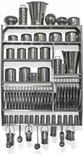
Curry 2, 2005 ustensiles en acier inoxydable 220 x 138 x 39 cm Collection privée, Suisse

Né à Khagaul, Bihar en 1964. Vit et travaille à New Delhi.