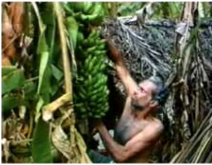
Tragedy of an Indian Farmer , 1993 court-métrage, 6'20"