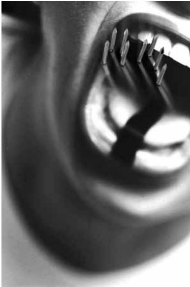
CALABOCA/SHUTUP, Paralela , 2006 Vidéoperformance, 52'

Née en 1953 à São Paulo (Brésil), où elle vit et travaille.