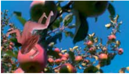
I Drink Your Bath Water , 2008 court-métrage, 2'32'' épisode du film Histoires de droits de l'Homme production ART for The World, Genève

Née en 1962 à Grabs. Vit et travaille à Zurich.