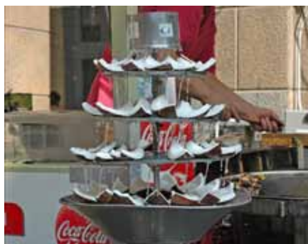
La voglia matta, 2012 noix de coco, eau, son Courtesy de l'artiste et Galleria Raffaella Cortese, Milan

Né à Codogno, Lodi, en 1966. Vit et travaille à Milan.