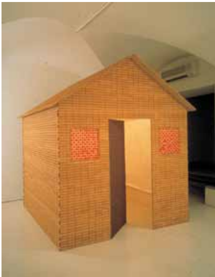
Dumme Gans, 2002 structure en bois, biscuits, bonbons, dessins 250 x 220 x 260 cm Courtesy de l'artiste Photo Claudio Abate / Galerie Valentina Bonomo, Rome

Née en 1961 à Milan, où elle vit et travaille.