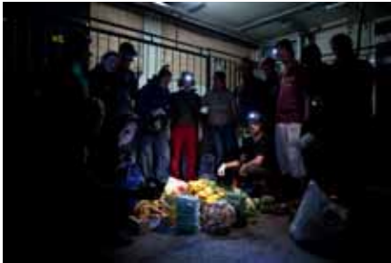
Days in Trash, Salzburg, 2012 documentaire, 10'