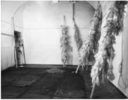
Senza titolo, 1968 Installation avec sacs en jute, graines de tournesol Dimensions variables

Né à Piraneus (Grèce) en 1936. Vit et travaille à Rome.