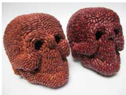
Reserva Natural, 2002-2012 haricots, papier-mâché, tissu, sciure de bois Courtesy de l'artiste