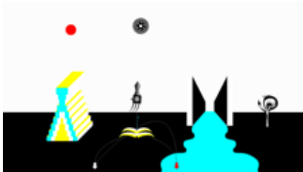
MetaphorsOfInfinity.com, 2012 site web online

Né en 1974 à Athènes, où il vit et travaille.