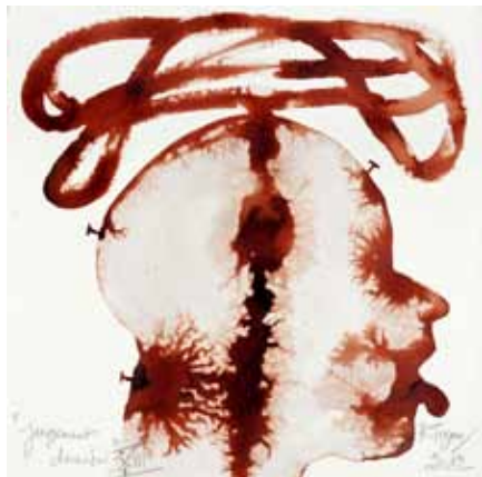
Le jugement dernier XII, 2012 aquarelle sur papier 38 x 38 cm